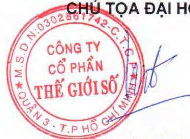
ĐOÀN HỒNG VIỆT